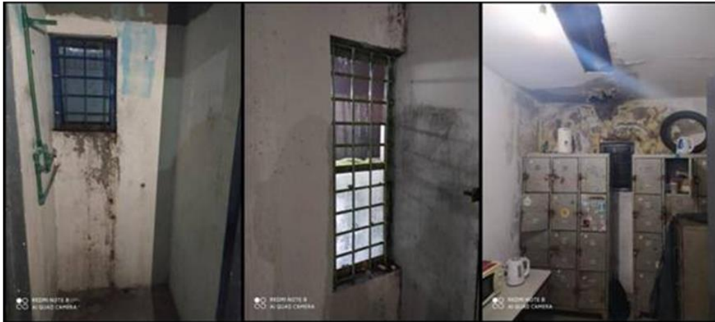
Ilustración 14 espacios en mal estado