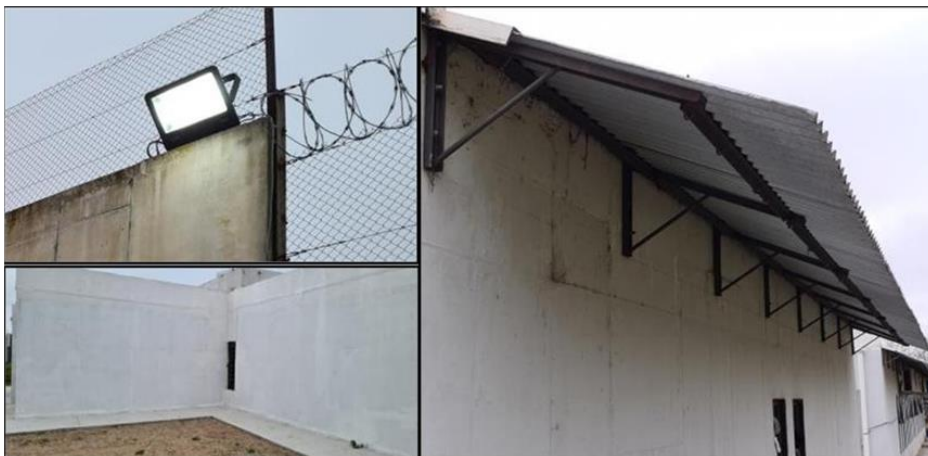
Ilustración 24 luminaria y alero nuevos