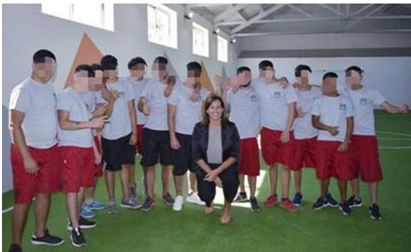
Ilustración 29 jóvenes y presidente de Inisa en la cancha