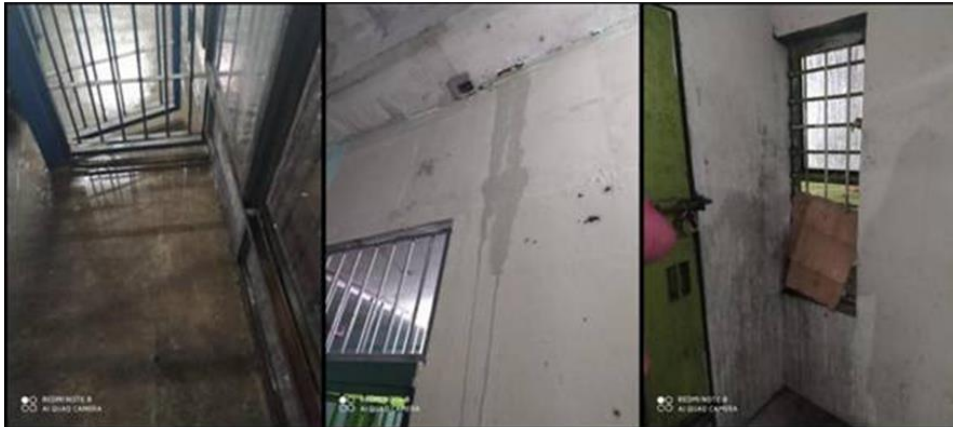
Ilustración 16 espacios en mal estado