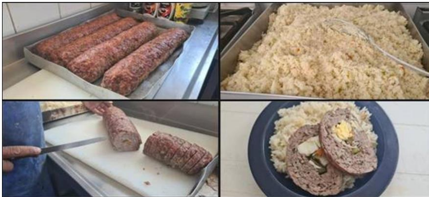
Ilustración 1 alimentos