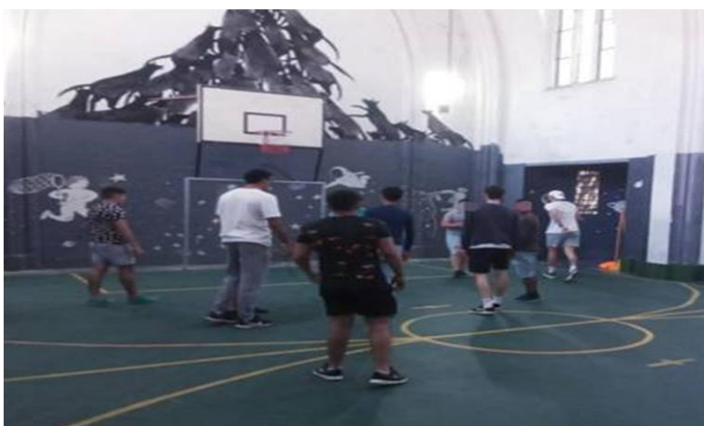
Ilustración 31 cancha de basquetbol