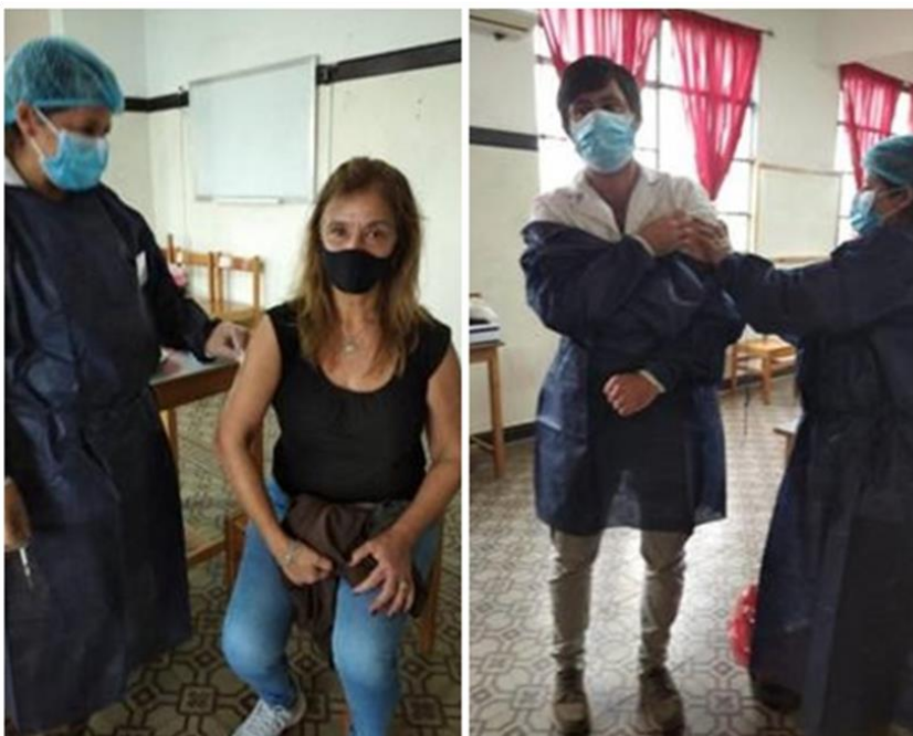
Ilustración 37 funcionarios recibiendo vacuna