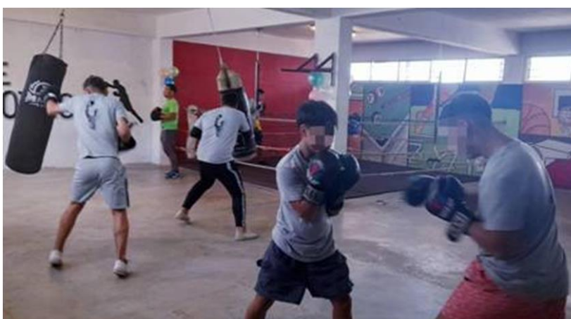
Ilustración 30 gimnasio de boxeo