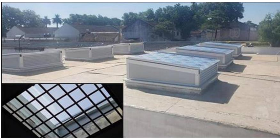
Ilustración 27 techo y ventilación refaccionados