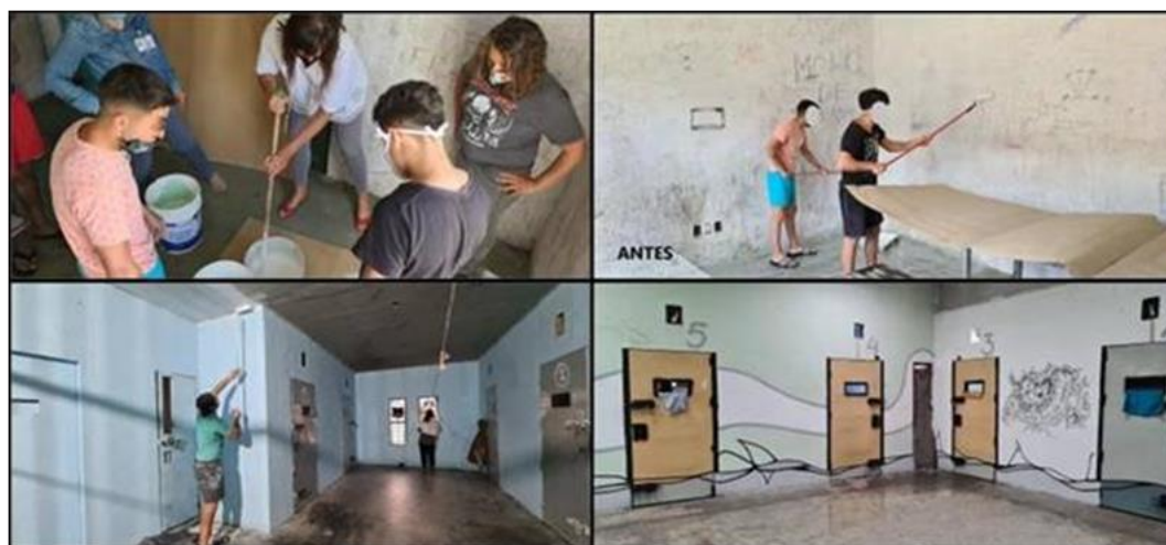
Ilustración 20 espacios en refacción