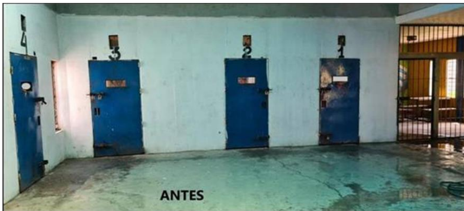
Ilustración 17 módulo