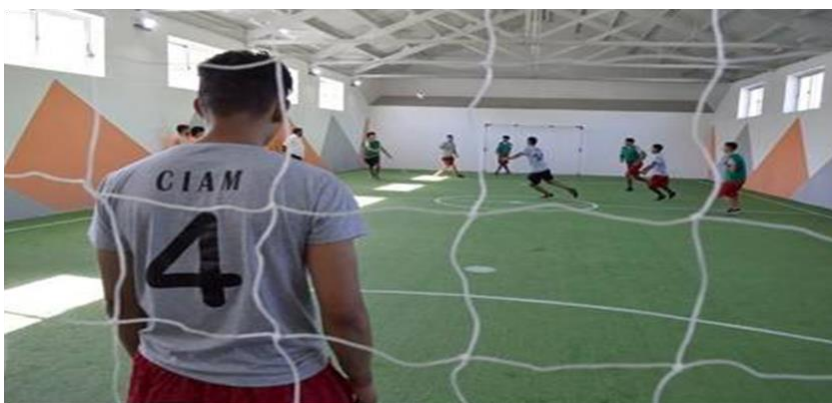
Ilustración 28 cancha cerrada