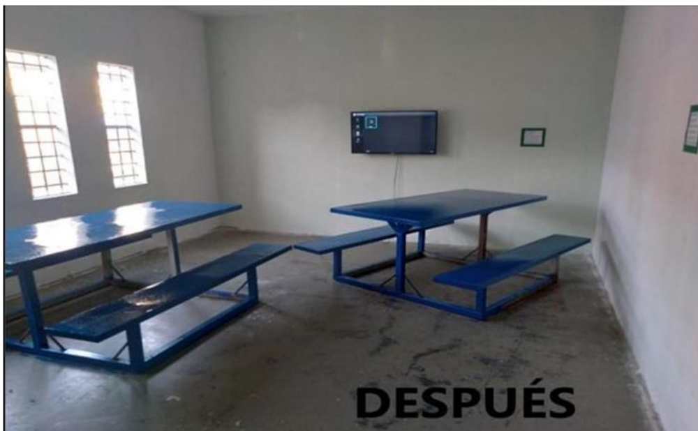
Ilustración 22 sala de visita refaccionada