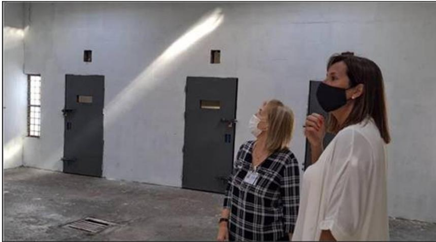
Ilustración 26 visita al módulo presidente de Olivera