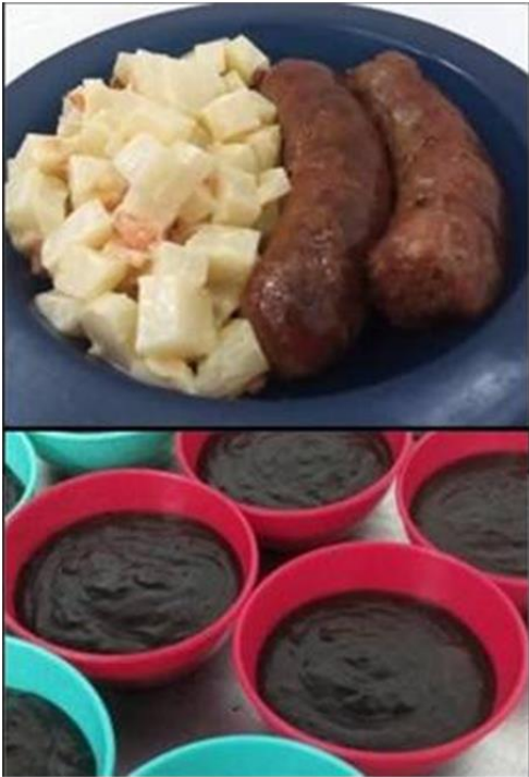
Ilustración 6 alimentos