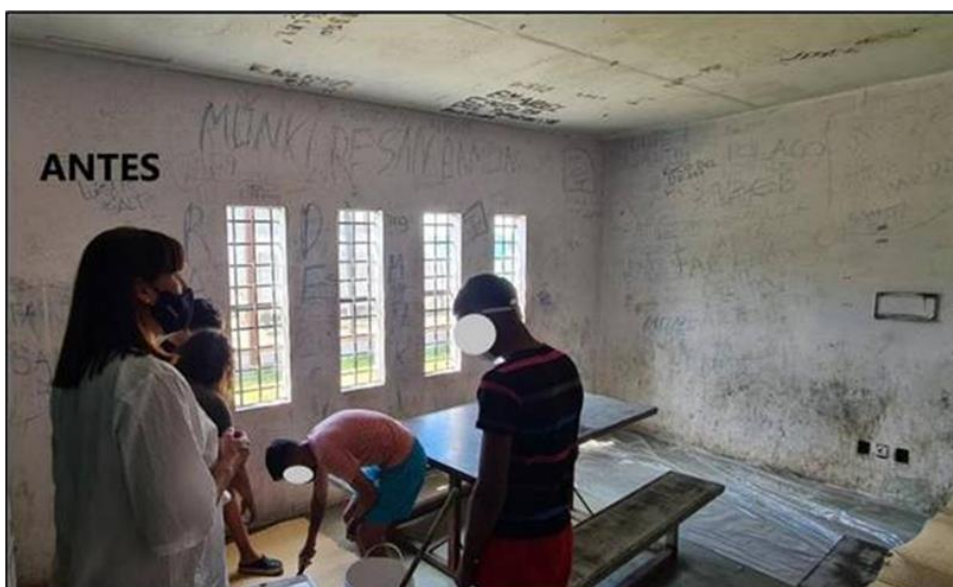
Ilustración 18 sala de visitas en refacción