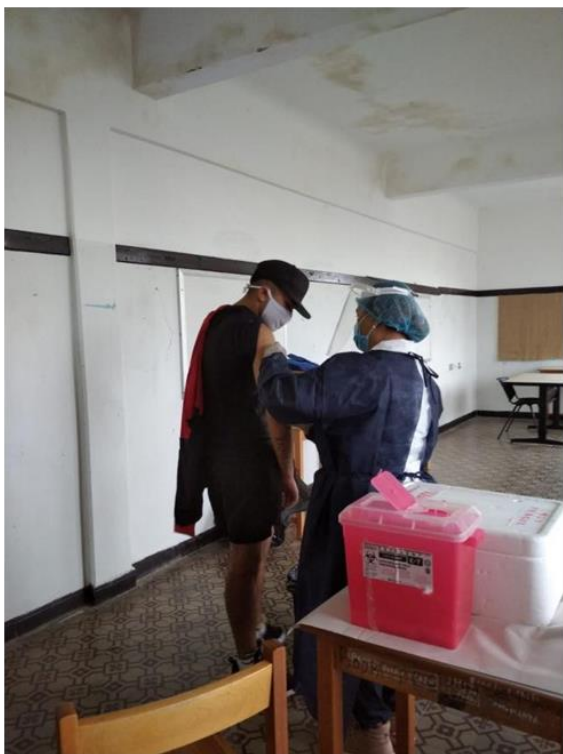
Ilustración 35 joven recibiendo vacuna contra Covid