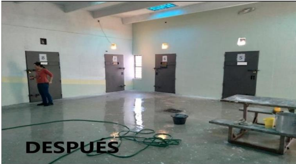
Ilustración 21 módulo refaccionado