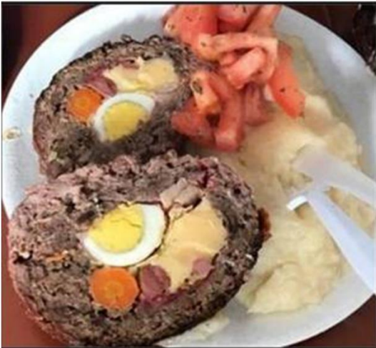
Ilustración 7 pan de carne con puré