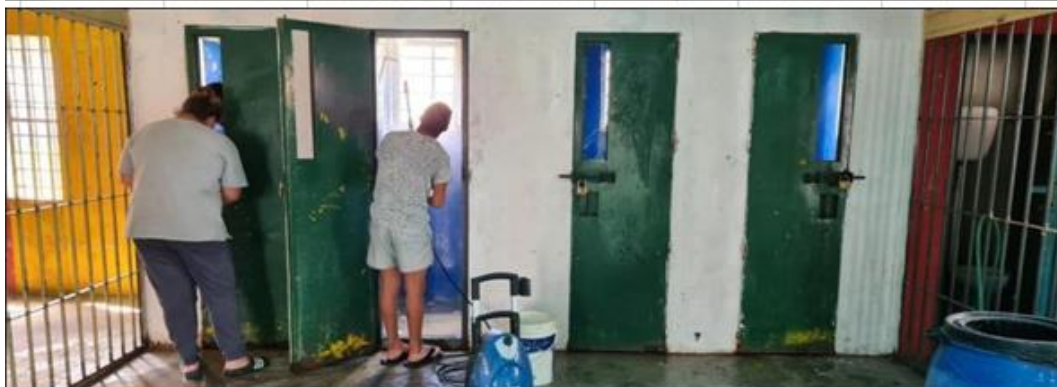
Ilustración 19 limpieza y pintura de puertas