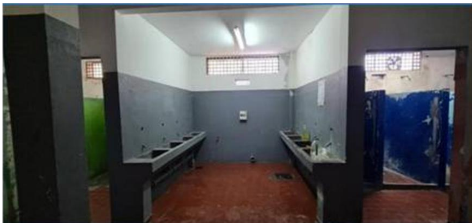
Ilustración 13 baño