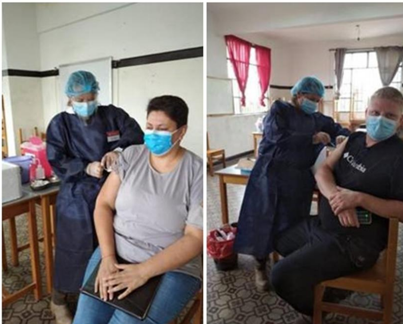
Ilustración 36 funcionarios vacunándose