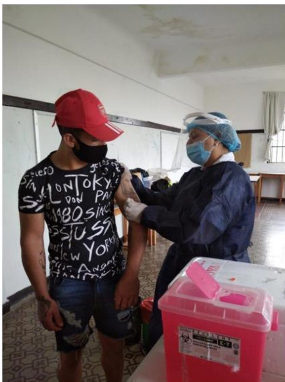
Ilustración 33 vacunación Covid