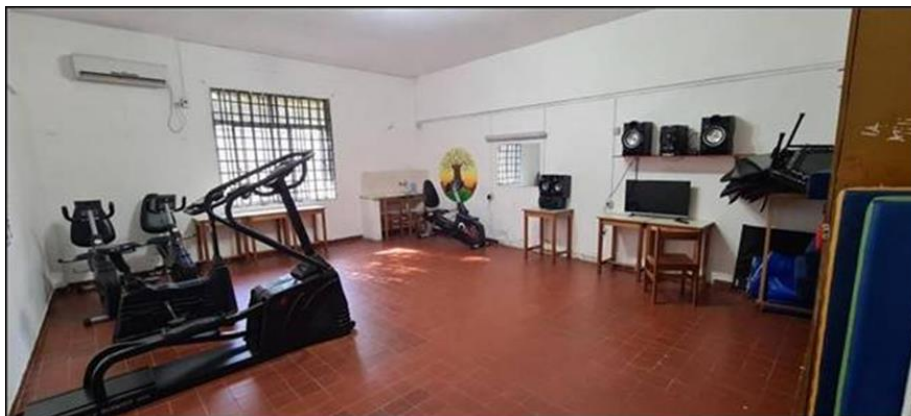
Ilustración 12 gimnasio