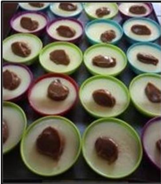
Ilustración 4 postre