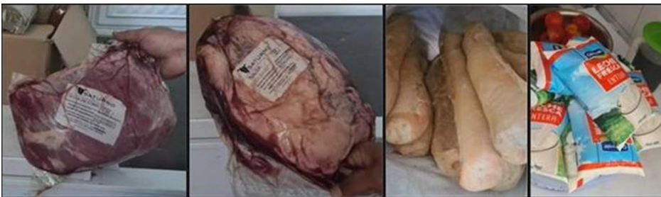
Ilustración 8 piezas de carne, pan y leche