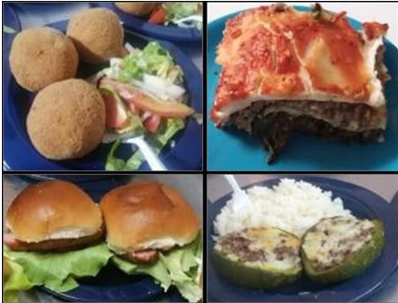
Ilustración 9 alimentos