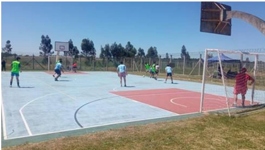
Ilustración 32 cancha al aire libre