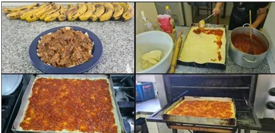
Ilustración 2 alimentos