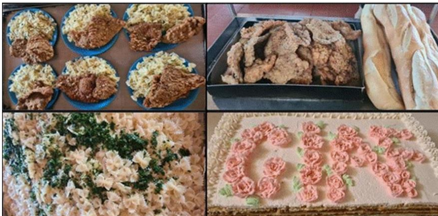
Ilustración 3 alimentos