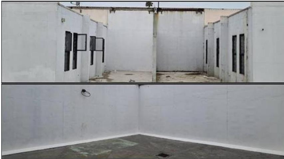
Ilustración 23 espacios exteriores refaccionados