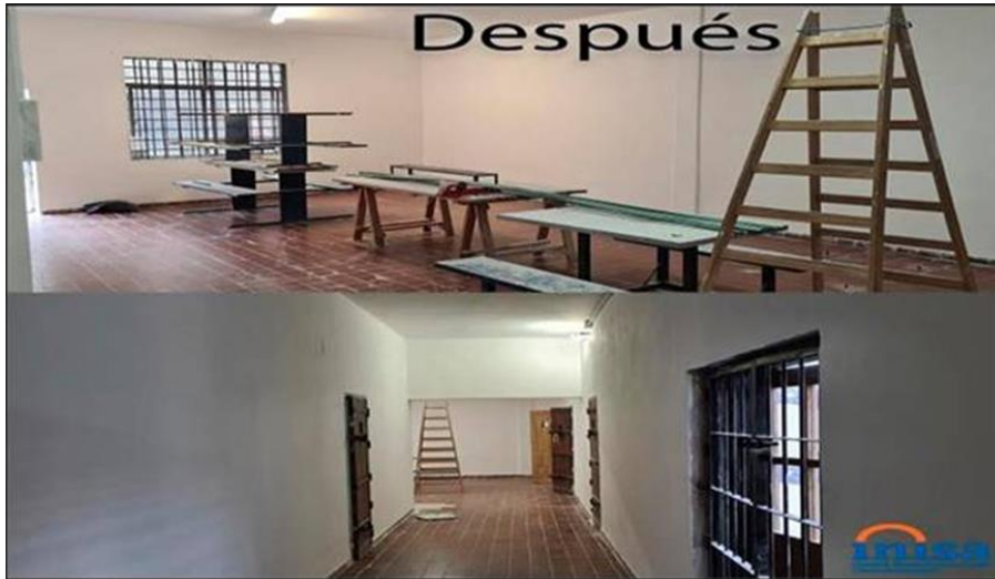
Ilustración 11 después