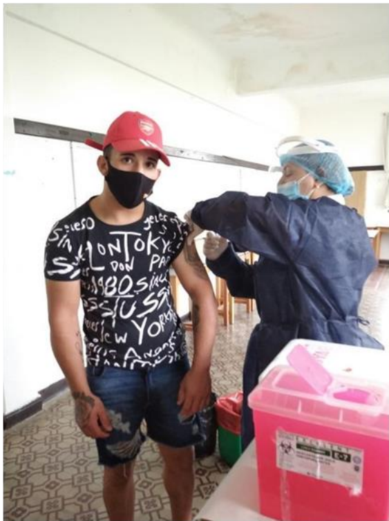
Ilustración 34 adolescente vacunándose