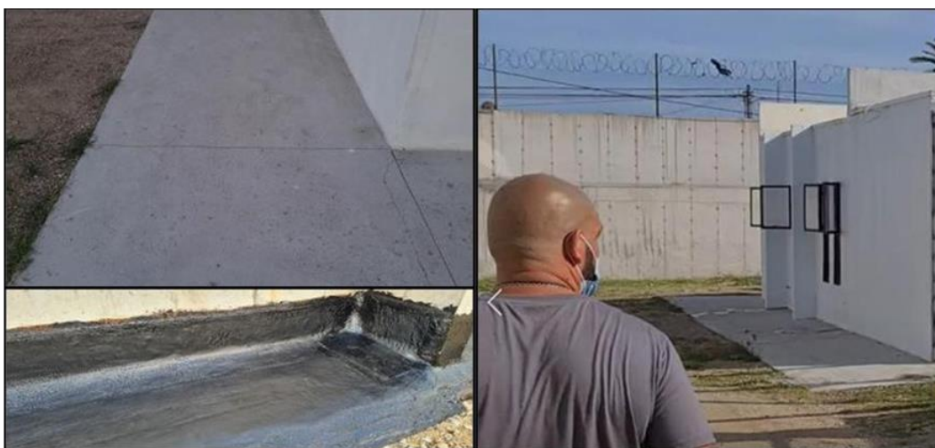
Ilustración 25 impermeabilización de techo y espacios refaccionados