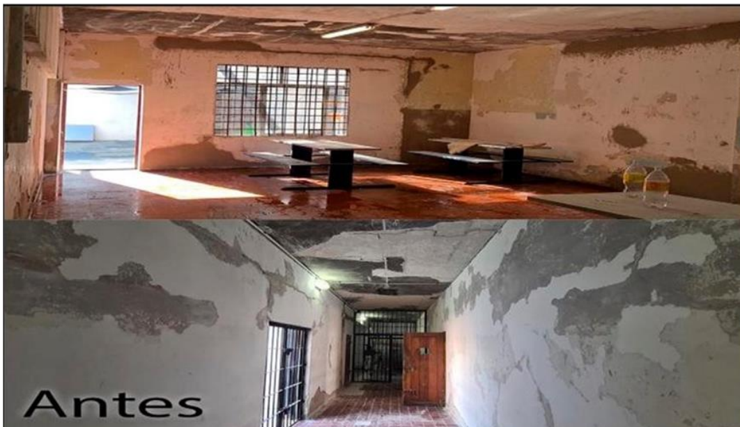
Ilustración 10 módulo y pasillo