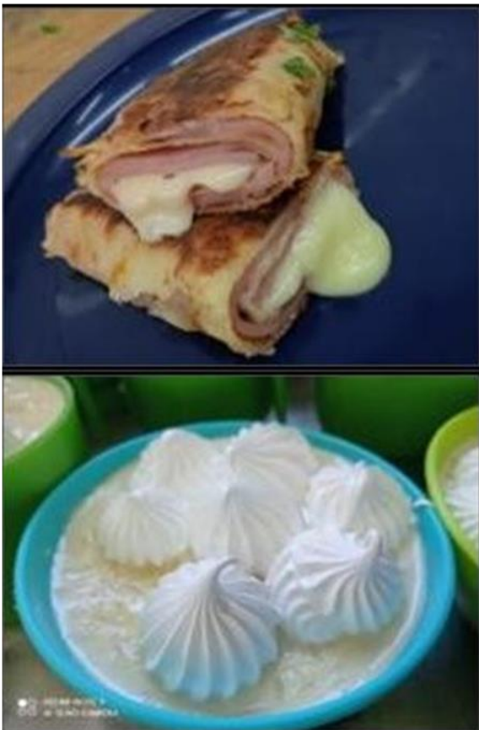
Ilustración 5 postre